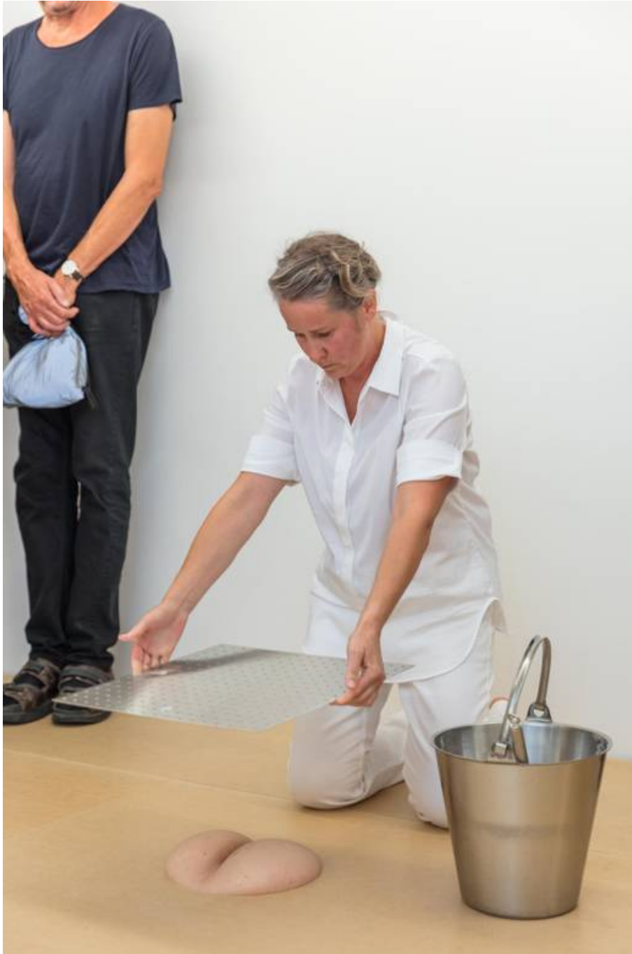
Kristina Matousch, "Bake", performance på Cecilia Hillström Gallery.

att använda olika föremål och göra vad de ville med hennes kropp. Någon kysste henne. Någon annan klippte isär hennes kläder. Hon blev skuren i halsen och en kniv stacks in i bordet mellan hennes lår. Mot slutet av kvällen var hon halvnaken, blödande och sårad. Abramovic blev också övertygad om att publiken kunde döda konstnären.