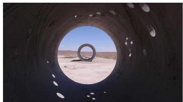
Nancy Holt, (1938-2014), "Sun Tunnels", 1976. Lucin, Utah, USA

Vilken annan konstnär har varit viktig för dig? Lee Lozano. ("I'm not angry. I feel rage.")