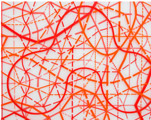
"Rymd" (detalj) © Sonja Larsson