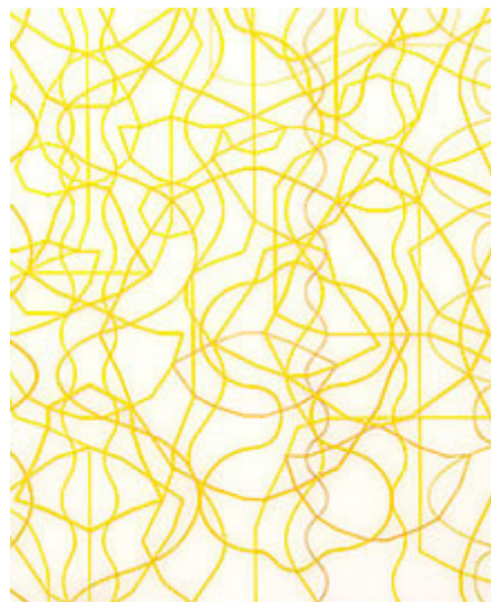
"Guld" (detalj) olja på akrylglas © Sonja Larsson