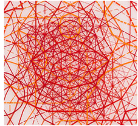
"Rymd" (detalj) © Sonja Larsson

Konstakademien, Stockholm | Omkonsts startside