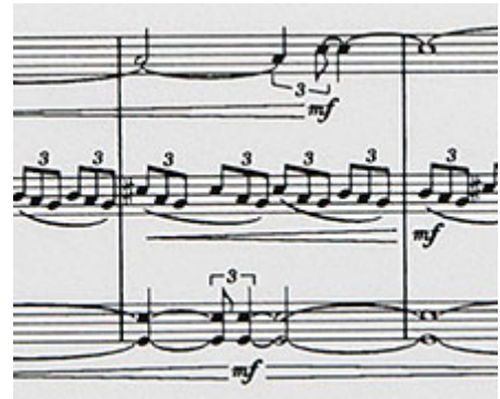
Detalj ur partitur © Molly Kien