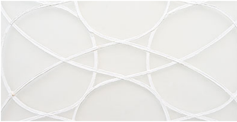
"Spiraler" (detalj) © Sonja Larsson

För mig finns det både i målningarna och i musiken ett drag av kommentar till tänkandets kapacitet, detta myller av associationer där tankar kan fara efter en slinga, ansluta till en annan, fortsätta blixtnabbt längs den nya tankelinjen för att i nästa sekund hitta en form och dröja i som en insikt.