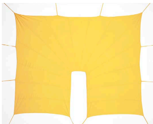
Linda Hofvander, "The stairs", 2021. Pigmenttryck.