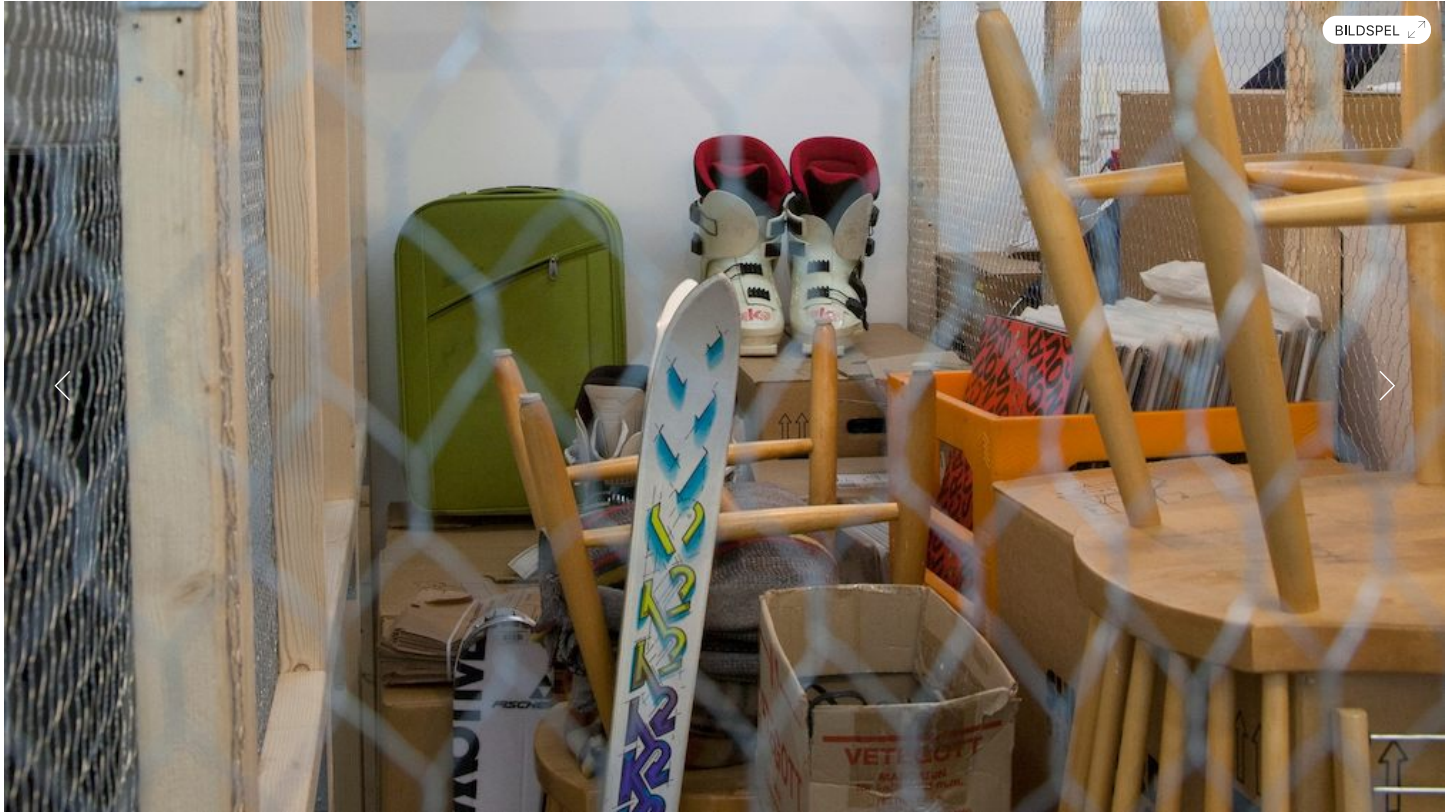
Bild 1 av 4 Vy från Johan Waerndts installation

Stockholms gallerier har öppnat vårsäsongen. Sebastian Johan och Birgitta Rubin gör fyra nedslag bland mentala rum och tidstypiska mätningar.