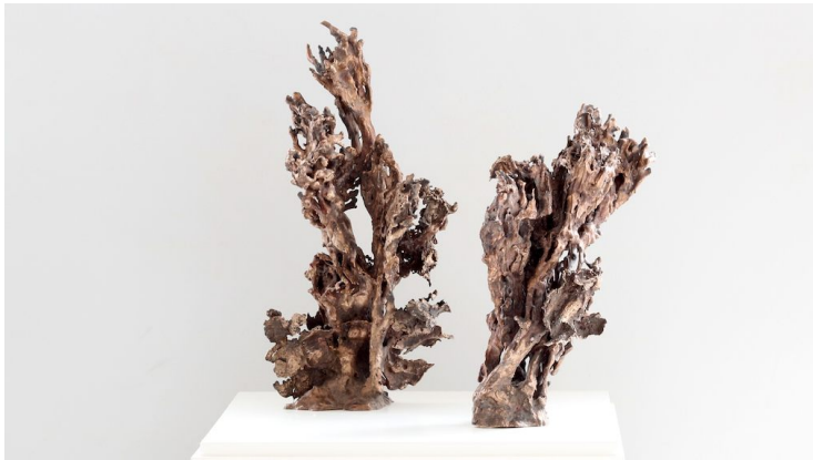
Skulpturer av Ellen Malmgard