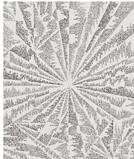
World in Relation © José Vera Matos

Cecilia Hillström Gallery, Stockholm | Galerie Nordenhake, Stockholm | Omkonsts startsida