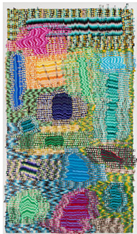
Sorting Molecules for M © Olivia Pettersson Fleur (Klicka på bilden för hög upplösning)

Hållslagets taktfasta perforerande som i pärmade papper eller hålkort skapar också referenserna till ljud; färgbruset och linjernas olika frekvenser fogar sig till rytmer, emellanåt till figurer. Ljudpoemen går högt upp i färg, men Oliva Pettersson Fleur håller också tillbaka med balanserande kontraster. Släppen av remsor över ytterkanterna förstärker känslan av att collagen låter sig avlyssnas. Det ska bli intressant att följa henne vidare och gärna i stora format.