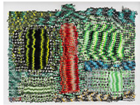
Clusters © Olivia Pettersson Fleur