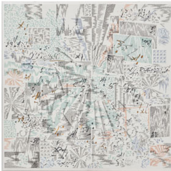
World in Relation (Klicka på bilden för hög upplösning)