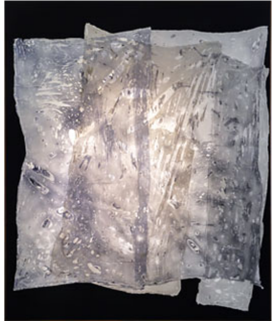
(Klicka på bilden för hög upplösning)