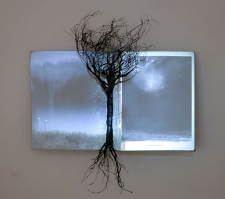
© Johannes Heldén (Klicka på bilden för hög upplösning)