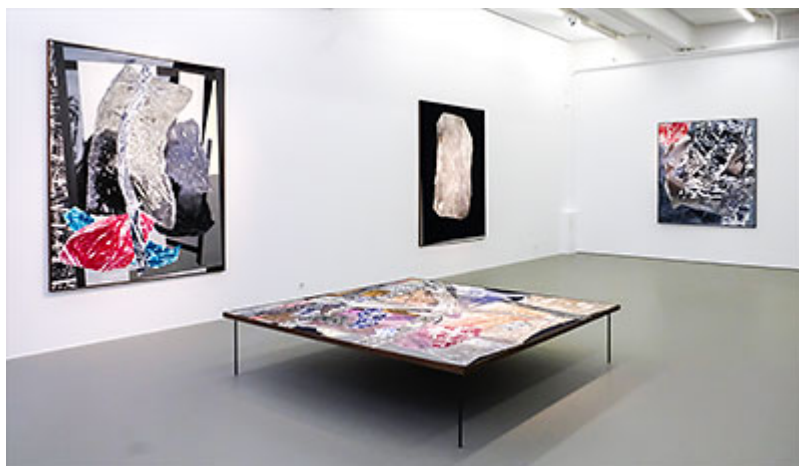
Utställningsvy