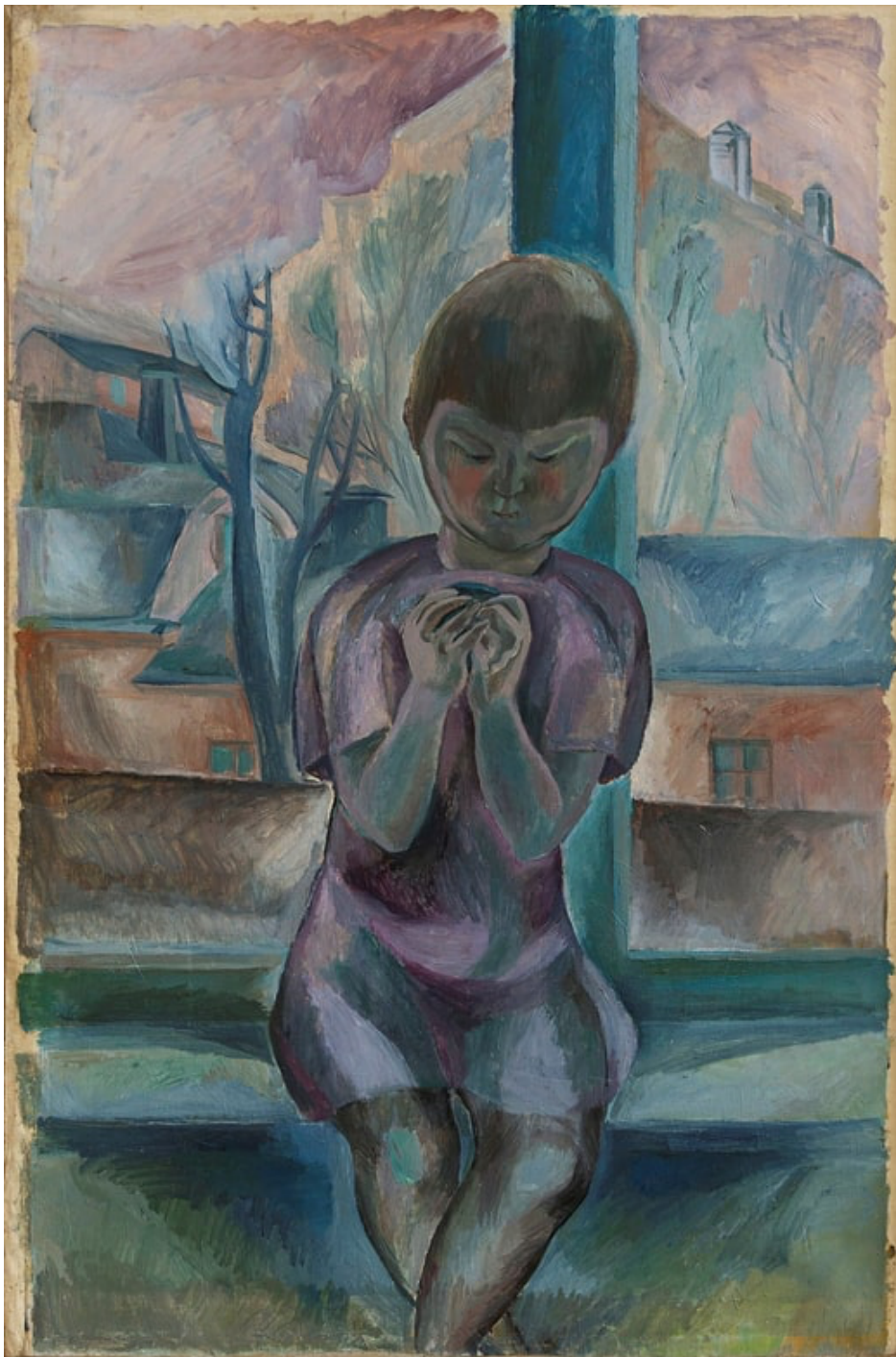
Siri Derkert, "Sara i fönstret", 1924.

På utställningen finns även en rad porträtt av likasinnade väninnor i främst Fogelstadgruppen, förstudier till monumentalverket på Östermalms t-banestation, ett stenkast från galleriet.