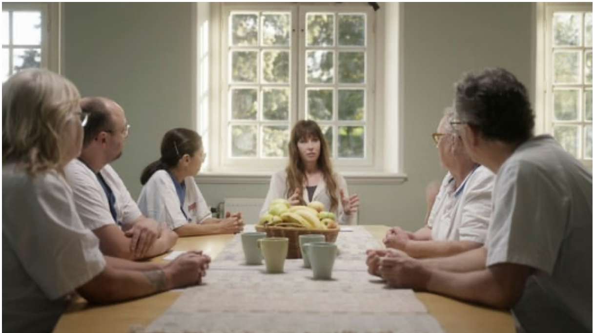
Stillbild ur Anna Odells videoverk ”Rekonstruktion – Psyket” på Cecilia Hillström gallery.