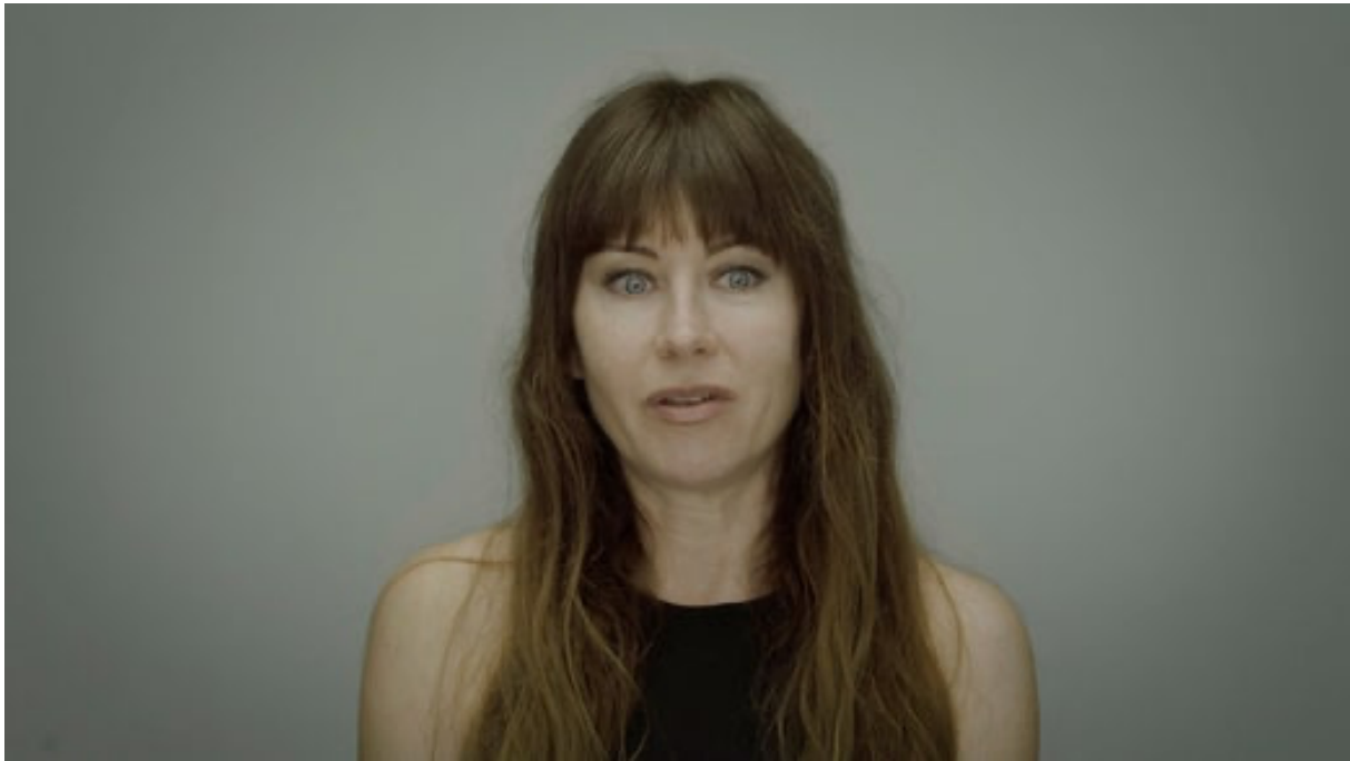
Stillbild ur Anna Odells videoverk ”Rekonstruktion – Psyket” på Cecilia Hillström gallery.

Fortsättningen bygger på Odells telefonsamtal med dem som i verkligheten var vårdansvariga. Hon vill få svar på sina frågor – både om det hon minns klart och det som är oklart. Under de psykologiskt avslöjande samtalen vilar kameran på Odells ansikte, med subtila skiftningar i mimiken. Närbilderna glider mellan de två skärmarna och ackompanjeras av symboliska åkningar genom en sjukhuskorridor omväxlande med en kulvert.