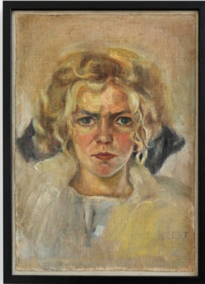
Siri Derkert, "Självporträtt", 1906-08.

För den som behöver en uppbygglig upplevelse av en historisk konstnär med civilkurage och uttrycks kraft ska bege sig till galleri Andréhn-Schiptjenko. Där visas närmare 50 verk av Siri Derkert (1888-1973), från kvarlåtenskapen som barnbarnen förvaltar. Det är ett väldigt fint urval, mest teckningar och illustrationer men också några små bronskulpturer, ristningar i betong och metall, liksom ett tiotal målningar på duk och papper.