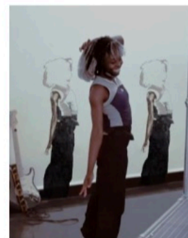
"Basically" på Bergen Kunsthall. Video: Saye Oyama, bildredigering: Salomon Leonard Poutsma.

Conny Karlsson Lundgrens innerligt installerade verk "Our trip to France (Mont des Tantes)" var en av höjdpunkterna på 2021 års upplaga av GIBCA, Göteborgs internationella konstbiennial. Bonniers konsthall presenterar under