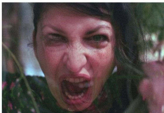
Selma Selman, "Superpositional letters to Omer", 2023.

Chaïm Soutines (1893–1943) distinkta, intensivt uttrycksfulla stil framkallar ett slags ångestlad yrsl. För ett par år sedan blev hans porträttmålning "Eva" symbolisk för delar av den belarusis-