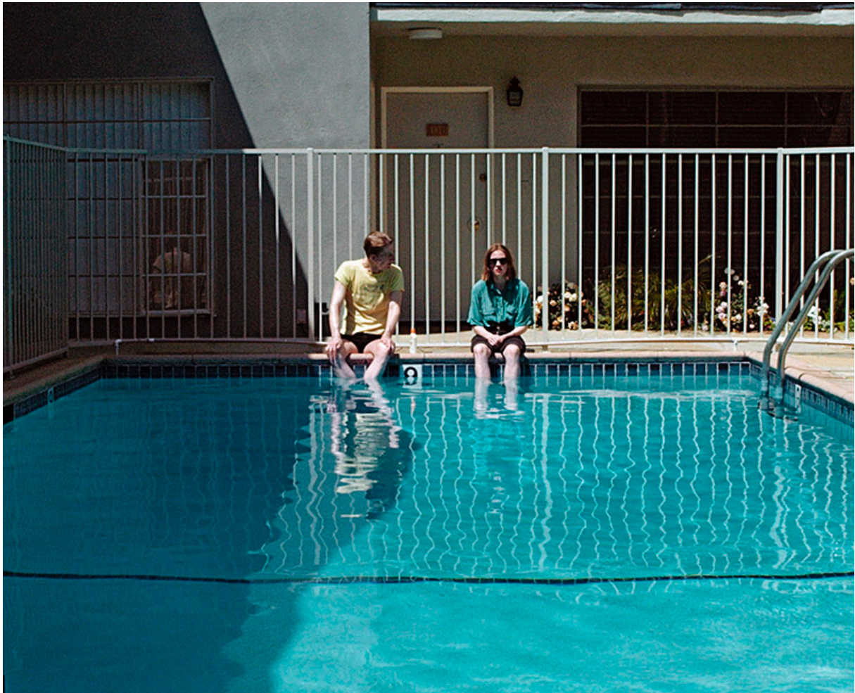
Tova Mozard, Pool, 2023, C-print, 53 x 64.5 cm

Det har gått en dryg vecka sedan jag såg ILOVERUSS, och nu är jag tillbaka för öppningen av ILOVERUSS Part II som innebär att utställningen utvidgas med ytterligare ett rum där flera av Tovas fotografier med anknytning till filmen nu installerats. Men jag ska också få tillfälle att sitta ned en stund med konstnären.