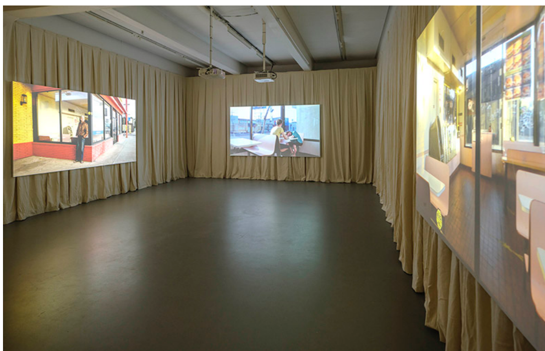
Installationsbild Tova Mozard, ILOVERUSS, 2023. Cecilia Hillström Gallery.

Det är jag och ett märkligt uttryckslöst par som kommit för att se filmen och när jag på väg från gallerikvarteret med en hårsman undgår att bli påkörd av en ljudlös bil som dyker upp ur intet, tycker jag det är passande.