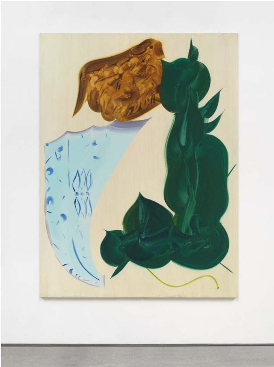
Patricia Tribe, "La Ripa", 2023.

Amerikanska Patricia Treibs stora abstrakta målningar på Nordenhake har ett mycket mer direkt tilltal. Hennes med breda penslar uppmålade organiska former tycks vara i rörelse, den utspädda oljefärgen likaså. Färgmässigt raffinerat och med utsparade mellanrumsformer som blir lika viktiga som det kalligrafiskt eleganta formspråket, lite som de pappersklipp Matisse ägnade sig åt mot slutet av sin levnad. Det är inte helt övertygande, men i den bästa målningen, "La Ripa", tycker jag mig se hur gröna blad dansar med en bit ådrat trä och en ljusblå porslinskärfva.