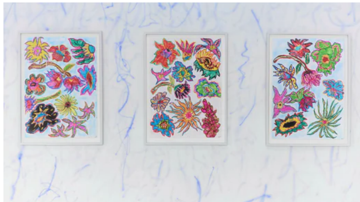
Målningar av Hank Grüner på Coulisse gallery.

Leiderstams modus operandi är sig också likt. I strikt geometriska målningar undersöker han ett av målarkonstens viktigaste hjälpmedel sedan renässansen, nämligen rutnätet (eller the grid, som det ofta kallas).