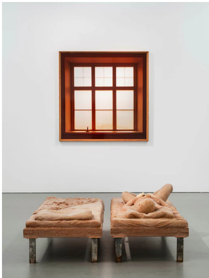
Vy från Lovisa Ringborgs utställning på Cecilia Hillström gallery.

På Cecilia Hillström Gallery , slutligen, visar Lovisa Ringborg en serie nya fotografier tagna med film som registrerar infrarött ljus, vilket ger bilderna en blodröd färgton. Motiven är längtansfullt melankoliska, med interiörer där en obäddad säng eller en ensam ljusstake i ett fönster ger associationer till stillsamma semesterdagar vid Medelhavet.