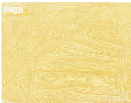
April , 2023