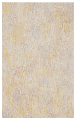
Öppen , 2023 © Viktor Kopp