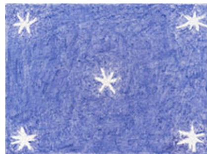
Hermes , 2023 © Marcus Matt

De båda har en bakgrund från konsthögskolan i Malmö men de kommer från olika generationer, Kopp är född 1971, Matt 1992. Det de framför allt har gemensamt är en mättad, torr och nedtonad färgpalett och ett sätt att applicera färgen på duken där penselns rörelsemönster blir till en viktig del av uttrycket.