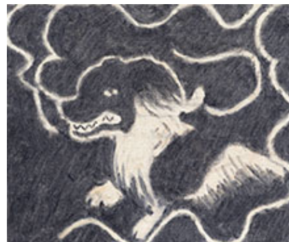
Dog's Dream , 2022 © Marcus Matt

Av de båda är Marcus Matt den, på gott och ont, mest kryptiska. Hans målningar följer ingen uppfattbar linje och är omväxlande figurativa och abstrakta. Två av målningarna har direkta referenser till den grekiska mytologin, men kopplingen mellan titlarna och verken låter sig inte fångas och blir till en lite störande mystifierande gest som lägger sig mellan mig och de i sig vackra målningarna.