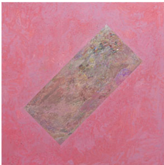
Untitled , 2023, opd, 85 x 85 cm © Viktor Kopp (Klicka på bilden för hög upplösning)