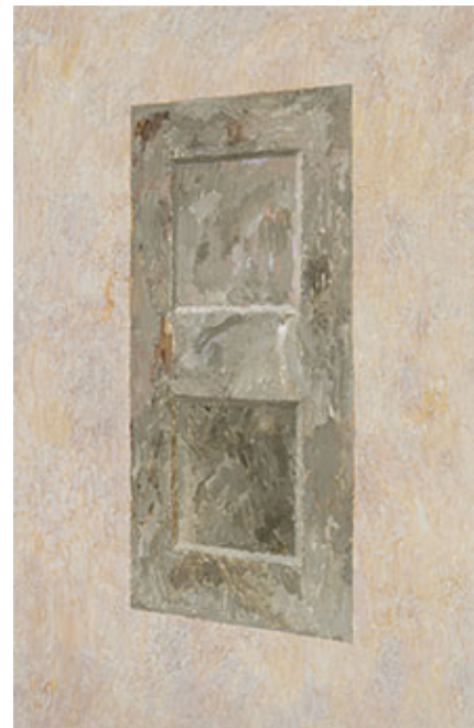
Öppen dörr, 2023, opd, 120 x 75 cm © Viktor Kopp,

Cecilia Hillström Gallery, Stockholm | Omkonsts startsida