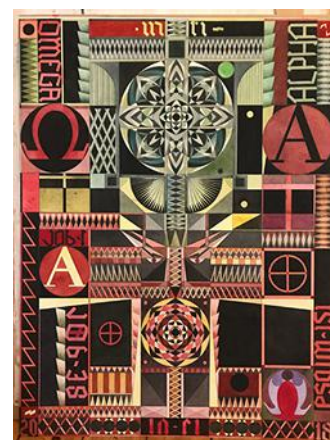
Fredrik Söderberg, "Job", 2018. Bild: Courtesy of Cecilia Billström Gallery / Konstnären