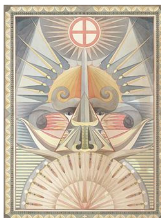
Fredrik Söderberg, Portrait of Pan, 2011