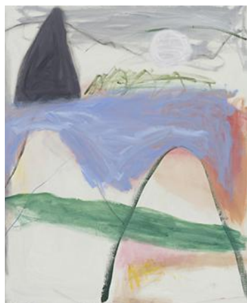
Jongsuk Yoon, "Future", 2018 Bild: Creative commons erkännande