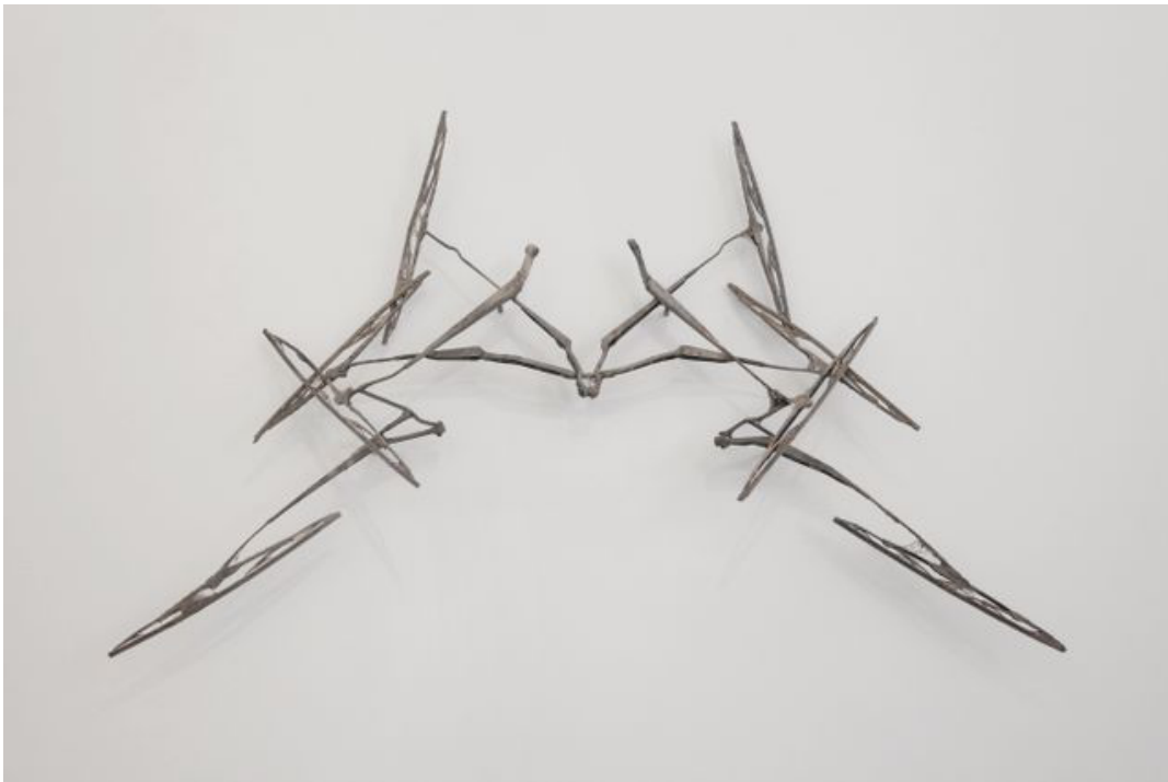
Ohlsson/Dit-Cilinn, "AUX (Grey queen)", 2019. Vindrutetorkare, silke.

Inte för att det vilar särdeles mycket daoism över Ohlsson/Dit-Cilins "Hypnotikon". Här finns snarare ett mischmasch av referenser och tekniker, där ekologiska föremål möter antik mytologi och thailändska hustempel, konstruerade av funna objekt. Stärkt av Söderbergs andlighet ser jag ändå något daoistiskt i konstnärernas vilja att visa en väg. Här blir det också tydligt hur Söderbergs och Ohlsson/Dit-Cilins andlighet skiljer sig åt, följer olika vägar. Där den förre leder mot den personliga introspektionen, vill de senare visa betraktaren på en mängd (förvisso osannolika) samband. De tar därmed guidens roll.