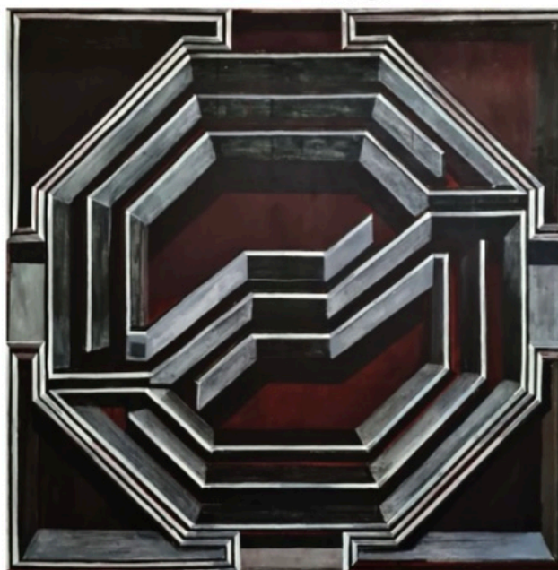
Linnea Rygaard, "Carrie", 2022. Akryl på duk.

Rygaard laborerar skickligt med ljus och skugga men jag saknar draget och färgerna och de mer hisnande perspektiven från tidigare målningar. Samtidigt förstår jag nödvändigheten i att fördjupa måleriet, och ta det vidare med dessa mer nedtonade bilder. ■