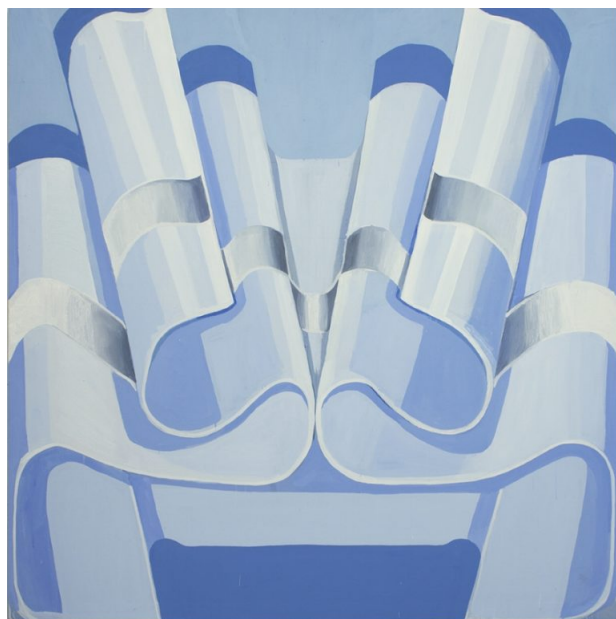
Foto:Foto: Jean Baptiste Béranger/Cecilia Hillström Gallery, Hälsingegatan 43. Utställningen pågår 6 april – 13 maj 2017