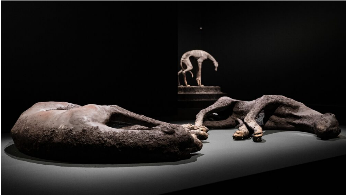
Lovisa Ringborg, "Stray dogs".

DN:s kulturredaktion om deras favoriter inom konst, litteratur och podcast.