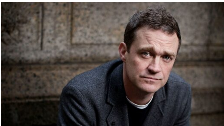
Patrick Radden Keefe.