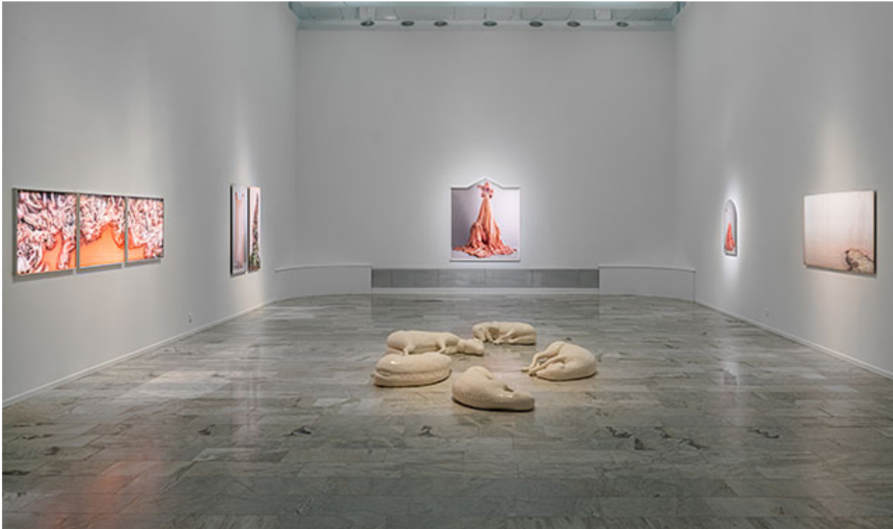
Installationsvy © Lovisa Ringborg (Klicka på bilden för hög upplösning)

Livet självt , i sin mest grundläggande mening, och dess förändringsprocesser, står i centrum i Lovisa Ringborgs Phantom Limbs på Norrköpings Konstmuseum. Den högt hängande, cirkelformade svartvita videoprojektionen Liquid Moon imploderar och expanderar som pulserande celldelningar i ett roschachmönster. Det fångslar som att stirra på en eld i sin ständiga föränderlighet, medan Jenna Hulténs ljudmatta lägger en känsla av uråldrighet över utställningsrummet. Ett rum som är svalt till temperaturen, dämpat i belysningen och har en sakral stämning.