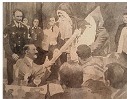
The Gift , 26x30 cm © Fredrik Söderberg

Stockholm 2020-02-28 © Kristina Maria Mezei