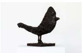
Donald Baechler, "Recent birds".

Dan Backman skriver om musik och konst i SvD. Läs fler texter på svd.se/av/dan-backman