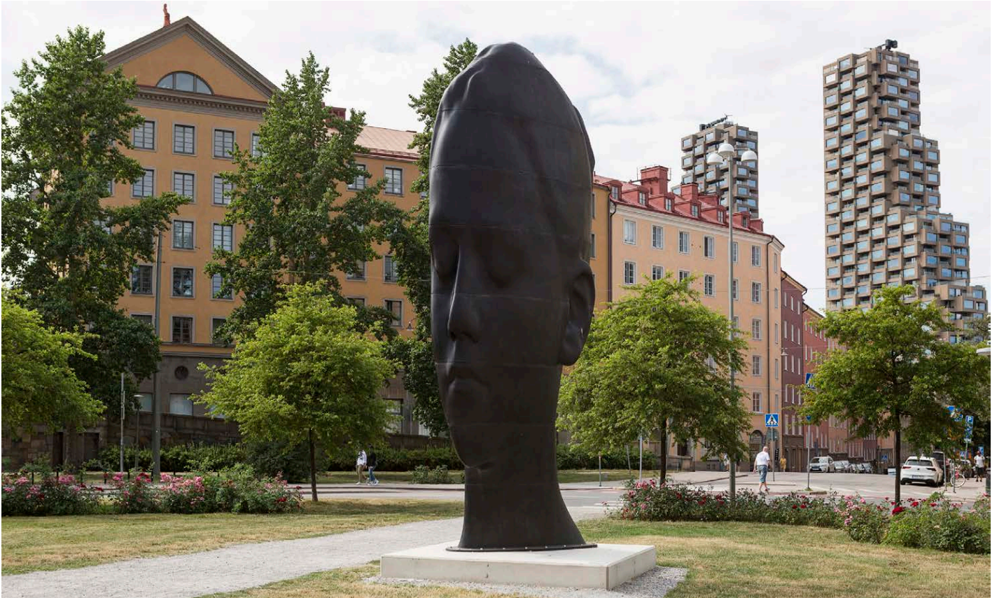
"Carlota" av Jaume Plensa, skulptur på Vanadisplan i Stockholm. Närliggande Galleri Andersson Sandström öppnar hösten med den katalanske konstnären.