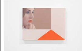
Ridley Howard, "Portrait, Tan and orange", 2021.

Jean-Paul Sartres meskalintripp och, naturligtvis, berättelsen om när Alice ramlade ner i Underlandet är blott några spår att följa.