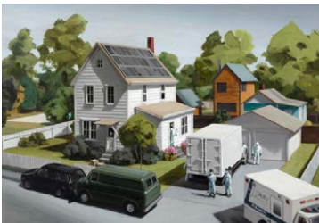
Amy Bennett, "Quarantine", 2020.