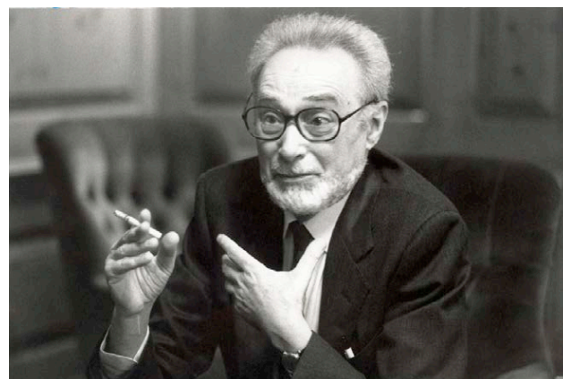
Primo Levi, fotograferad i april 1986, ett år före sin död.