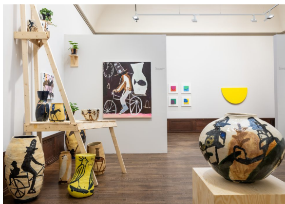
Installationsvy med verk av Mie Olise Kjærgaard hos Hans Alf Gallery.