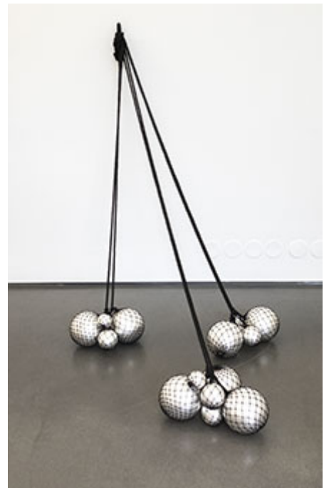
Floats , 2017 © Ebba Matz

Cecilia Hillström Gallery, Stockholm | Omkonsts startsida