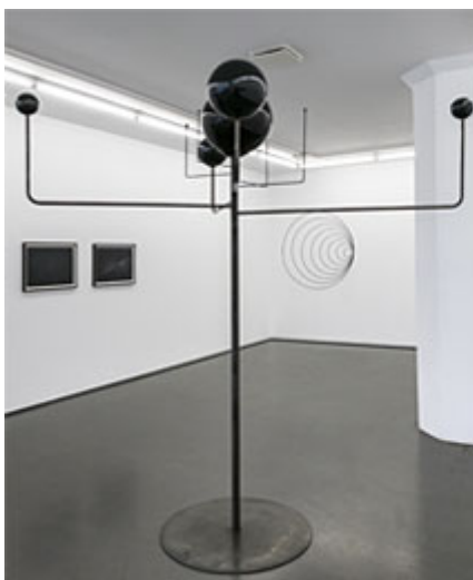
8 minutes 20 seconds , 2017 © Ebba Matz