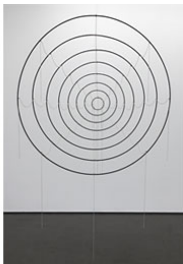
Trap , 2017 © Ebba Matz

Det planetära undergångsspelet är laddat med inbjudande tankegods och referenser. Titeln 8 minuter och 20 sekunder (fast på engelska), representerar tiden det tar för oss jordbor att uppfatta att solen har slocknat. Är det den sista skålen hon bjuder i sina skrin, cyankalium och champagne, när den stora skuggan väl faller? Lamentationer över mänsklighetens litenhet och ogärningar på jorden torde vara ett drama som för närvarande värderas högt i