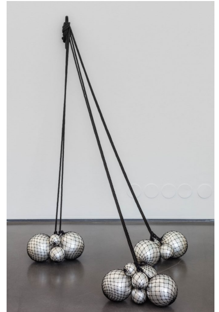
Utställningen pågår 24 augusti – 30 september 2017