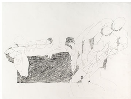
(klicka på bilden för hög upplösning)

Artikel om Hokusai på Millesgården 2018 >>