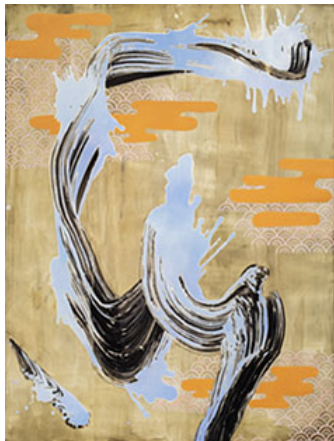
(klicka på bilden för hög upplösning)